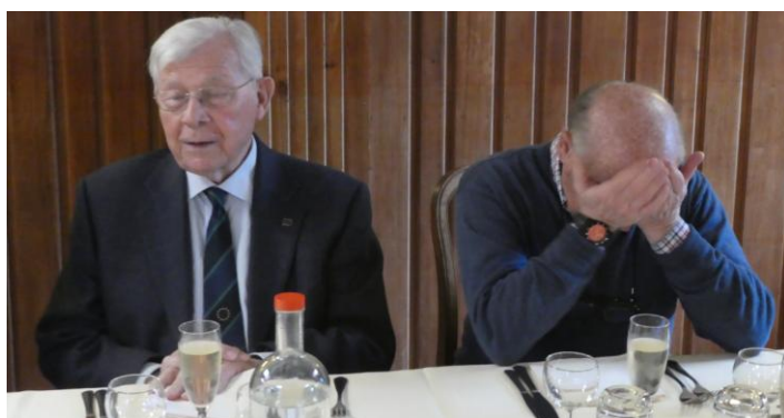
Les propos de Jean sont très émouvants